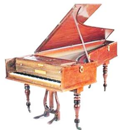
Piano Broadwood de 1817 ayant appartenu à Beethoven.