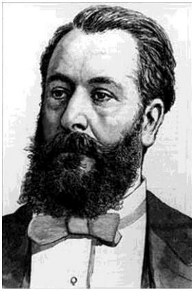
Léo Delibes (1836-1891)