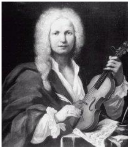
Antonio Vivaldi : 1678 - 1741