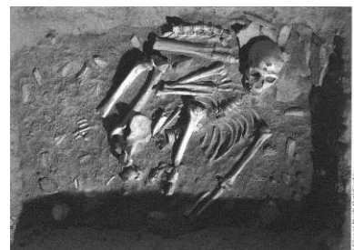
L'homme de La Chapelle-aux-Saints (Corrèze) dans sa tombe.

L'homme de Neandertal apparaît il y a 120 000 ans et disparaît il y a 32 000 ans. On l'appelle aussi homo sapiens neandertalensis ce qui signifie « homme savant ». Le cerveau de ce « cousin » était aussi gros que le nôtre.