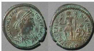
Monnaie du IV e siècle.