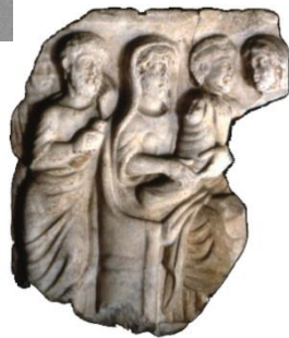
Morceau d'un sarcophage chrétien (IV e siècle) – Toulouse.

Lettre des chrétiens de Vienne et de Lyon à leurs frères d'Asie et de Phrygie.