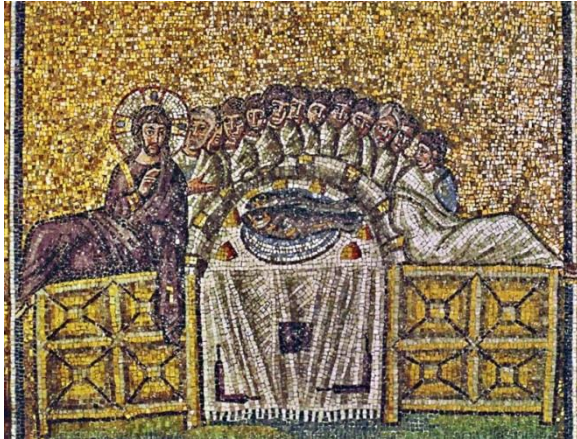
La dernière Cène (mosaïque - avant 540). Basilique Saint-Apollinaire-le-Neuf, Ravenne (Italie).