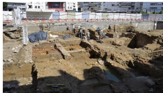
Saint Martial, évêque envoyé de Rome au III e siècle pour évangéliser la Gaule. Il fut inhumé, avec deux compagnons, Austriclinien et Alpinien, dans une crypte surmontée d'une petite basilique. – Fouilles archéologiques, Place de la République, Limoges, août 2015.

Histoire ecclésiastique d'Eusèbe de Césarée (V, Prologue 1-4 ; chapitres 1-4), SC 41.