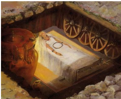
Tombe princière de Vix