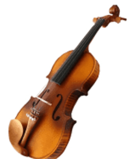
Instruments avec caisse de résonance