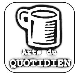
taille de l'oeuvre

Titre : le calendrier de Coligny Auteur : des celtes (= gaulois) Période d'activité : antiquité celte Date de création : I er siècle avant J. -C. Dimensions : 1,5 m x 0,90 m Technique : gravure sur bronze Lieu de découverte : Coligny (Ain) en novembre 1897